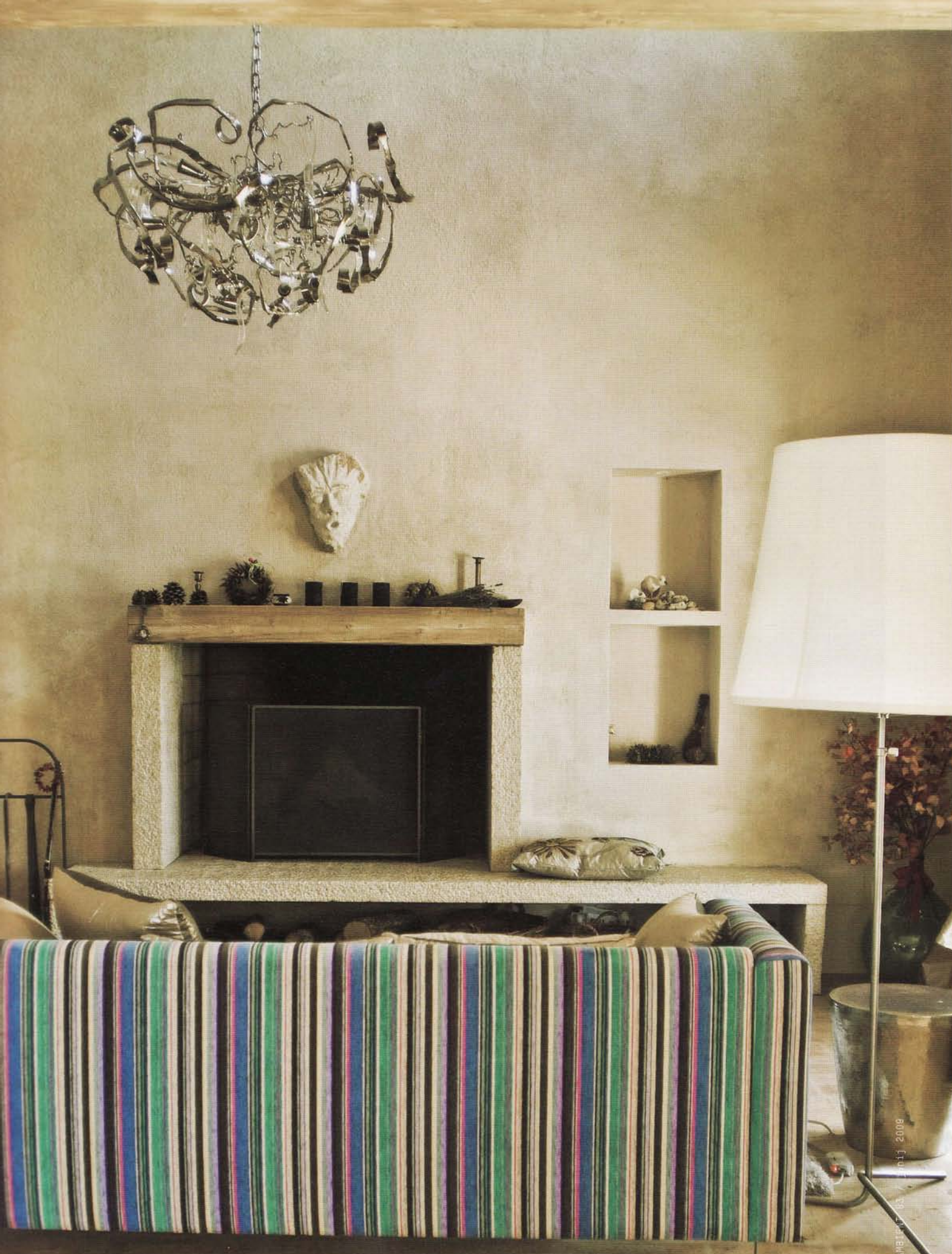
KAVČ PRED KAMINOM Z ODPRTIM KURIŠČEM JE OBLEČEN V ČRTASTO BLAGO TRISHE GUILD, VSE PRITLIČJE PA JE TLAKOVANO S STARIMI ISTRSKIMI TAVELICAMI.